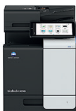
bizhub i-Series C4050i

По мере роста вашего бизнеса, мы будем расти вместе с вами — органично объединяя людей и пространство, создавая новое окружение с защищенными бизнес-процессами и документооборотом.