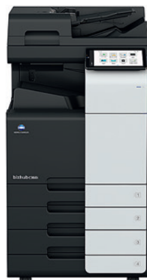
bizhub i-Series C360i